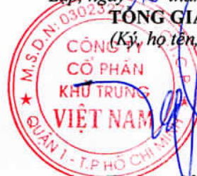
Trương Công Cừ